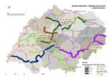
Figura 11. Drumurile publice propuse spre modernizare prin POR 2014-2020